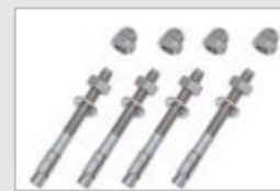
4 goujons de fixation