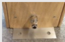
Branchement à la base arrière.

La douche est livrée avec 4 goujons inox (Ø 10 mm, longueur 96 mm) pour des sols types terrasse en bois, pierre ou béton.