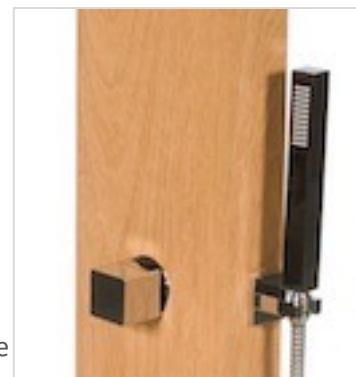
Détail douchette carrée et poignée carrée